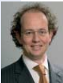
Jean-Louis SCHILTZ Ministre de la Coopération et de l'Action humanitaire