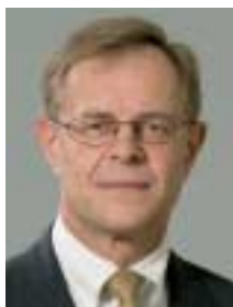
Fernand Boden Le président du Conseil des ministres de l'Agriculture de l'UE

J'espère que votre séjour au Luxembourg vous apportera beaucoup de plaisir et que vous garderez d'excellents souvenirs de cette réunion informelle.