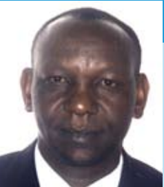
Thomas Minani Ministre du Commerce et de l'Industrie Minister of Trade and Industry