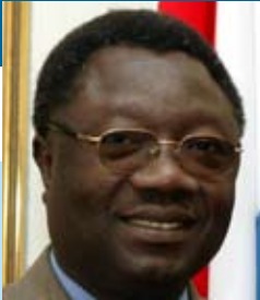
Jean-Baptiste Compaoré Ministre des Finances et du Budget Minister of Finance and Budget