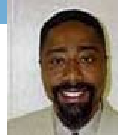
Victor Borges Ministre des Affaires étrangères, de la Coopération et des Communautés Minister of Foreign Affairs, Cooperation and Communities