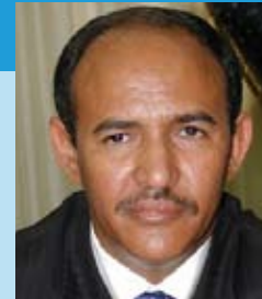
Sidi Ould Didi

Ministre des Affaires économiques et du Développement