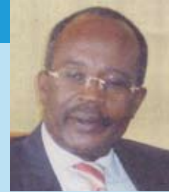
Casimir Oyé Mba

Ministre d'État, chargé de la planification et de la programmation du développement