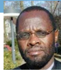
Peter Anyang' Nyong'o

Ministre de la Planification et du Développement