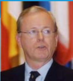
Armand De Decker

Ministre de la Coopération au développement