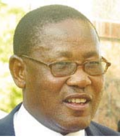
Mompoti Merafhe Ministre des Affaires étrangères Minister of Foreign Affairs