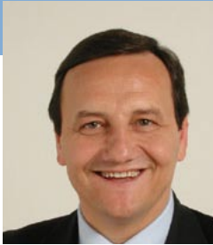
Mario Baccini Ministre de la Fonction publique Minister of Civil Service