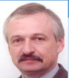
Evaldas Gustas Secrétaire d'État du ministère de l'Intérieur State Secretary of the Ministry of Interior