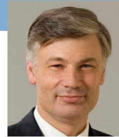
Claude Wiseler Ministre de la Fonction publique et de la Réforme administrative Minister for the Civil Service and Administrative Reform