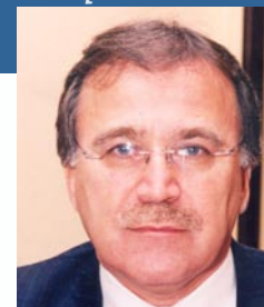
Mehmet Ali Sahin

Ministre d'État et Vice-Premier ministre