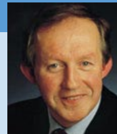
Tom Parlon Ministre adjoint au ministère des Finances, chargé des Travaux publics Minister of State at the Department of Finance, with special responsibility for the Office of Public Works