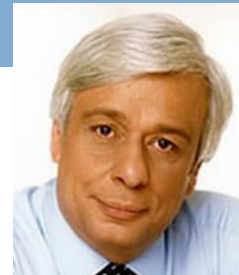
Prokopios Pavlopoulos Ministre de l'Intérieur, de l'Administration publique et de la Décentralisation Minister of Interior, Public Administration and Decentralisation