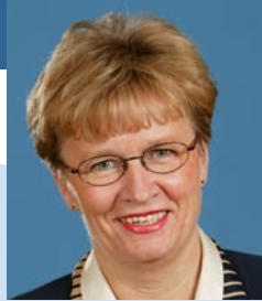
Ulla-Maj Wideroos Second ministre des Finances Second Minister for Finance