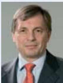
Jeannot Krecké Ministre de l'Économie et du Commerce extérieur

Nous vous souhaitons un agréable séjour dans la capitale et aux bords de la Moselle.