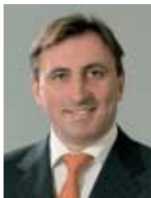
Jean-Marie Halsdorf Ministre de l'Intérieur et de l'Aménagement du territoire