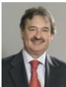
Jean Asselborn Vice-Premier Ministre Ministre des Affaires étrangères et de l'Immigration

Dans cet esprit, je vous souhaite un agréable séjour au Grand-Duché.