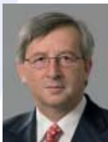
Jean-Claude Juncker Premier Ministre et Ministre des Finances

J'espère que dans cet esprit nos échanges nous permettront une fois de plus de faire avancer cette idée de l'Europe qui nous est chère, l'idée d'une Europe gagnante, juste et généreuse.