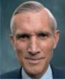
Bernard R. Bot

Ministre des Affaires étrangères Minister for Foreign Affairs