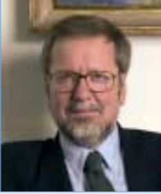
Per Stig Møller

Ministre des Affaires étrangères Minister for Foreign Affairs