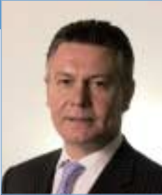
Karel De Gucht

Ministre des Affaires étrangères Minister for Foreign Affairs