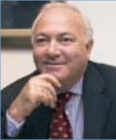
Miguel Ángel Moratinos Cuyaubé

Ministre des Affaires étrangères et de la Coopération Minister for Foreign Affairs and Cooperation